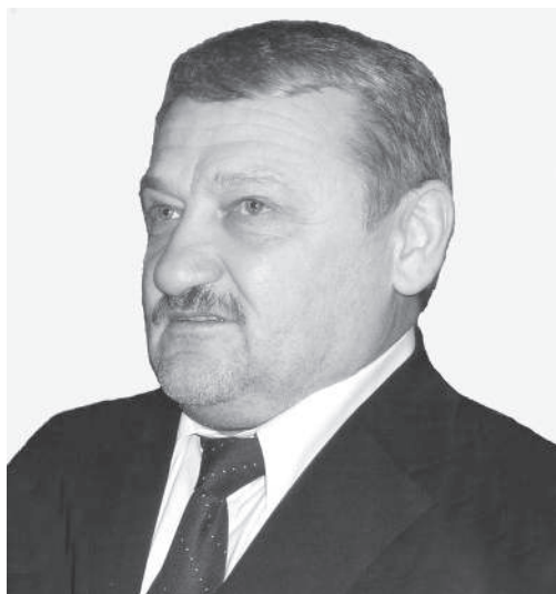
А.А. Кадыров – первый Президент ЧР.

Отечественные и зарубежные исследователи только приступают к изучению творческого и интеллектуального наследия Ахмат-хаджи Кадырова, который был не только исламским богословом и политиком, но и мыслителем, поэтом и публицистом. Мировоззрение, нравственная позиция, политические и философские взгляды Ахмат-хаджи наиболее ярко проявляются в интервью, в публичных выступлениях, обращениях к жителям республики, публицистических статьях. В них первый Президент Чеченской Республики пытается донести до жителей России, всего мира свое видение ситуации, предлагает свои рецепты решения многих проблем региона. Перед нами предстает мудрый, глубоко верующий человек с большим жизненным опытом и очень активной социальной позицией, не только блестящий исламский теолог,