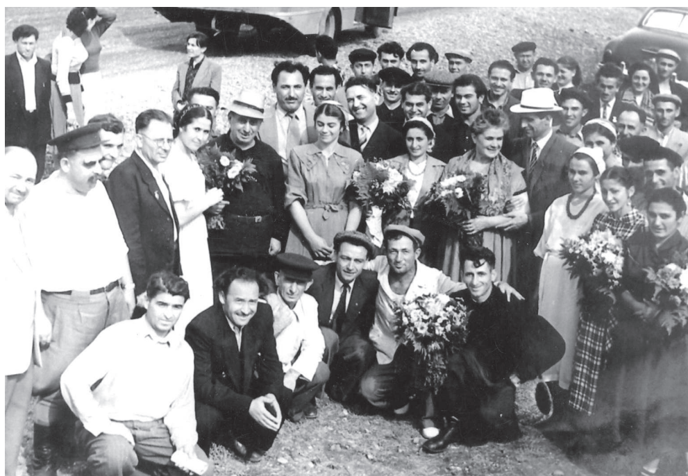
Артисты чеченского театра